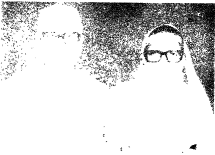
समसाय श्री व. भासा श्री धन्यकुमार जेन एन समेपनी श्रीमती सीतादेवी